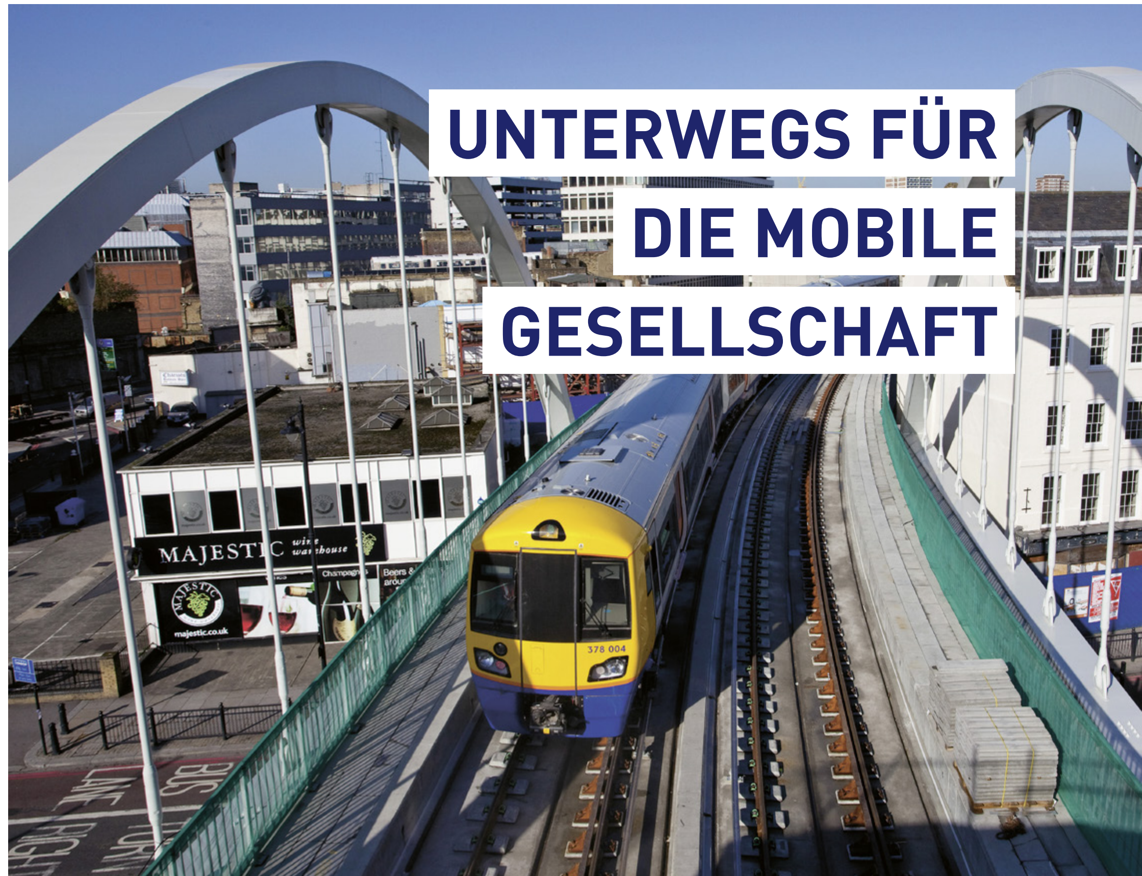
Internationaler Markt: Beim Bau der East London Line zur Erschliessung des Olympiageländes kamen Low Vibration Track Stützpunkte von Vigier Rail zum Einsatz.