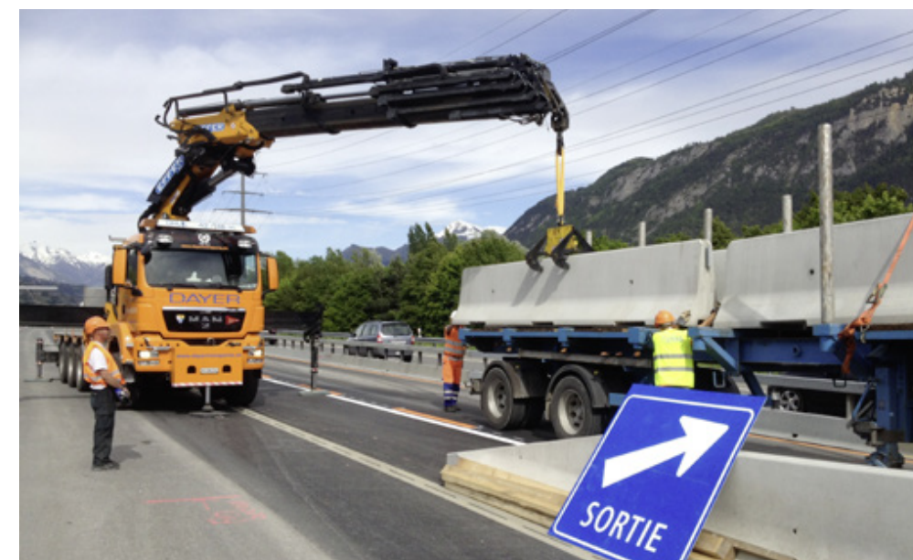
Walliser Lebensnerv: Die A9 wird mit dem Rückhaltesystem DELTA BLOC® ausgerüstet.

tragen eine grosse Verantwortung, denn das Werk liefert einen bedeutenden Teil des in der Schweiz benötigten Zements. Würde die Transportkette unterbrochen, stünden rasch überall im Land Baustellen still.