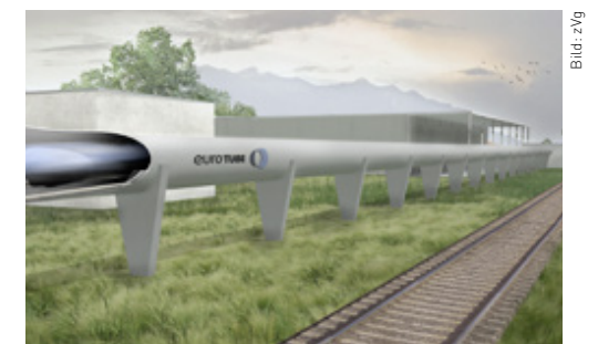
Creabeton Matériaux hat Prototypen für das Rohrsystem des Hyperloop-Projekts «Eurotube» entwickelt.

Ich bin überzeugt, dass wir wirklich gute Voraussetzungen haben. Wir haben uns in den letzten fünf Jahren auf der Prozess- und auf der Datenseite intensiv vorbereitet. Deshalb ist unsere Wettbewerbsposition gut. Ich glaube daran, dass wir auch in Zukunft eine Berechtigung in diesem Markt haben – vermutlich nicht mit allen Artikeln, aber noch verstärkter mit Dienstleistungen. Die Kunden schätzen schon heute unsere Kompetenz und unsere Praxisnähe, die wir in der Beratung beweisen. Ich hoffe aber, dass wir da in Zukunft in Sachen Services und Logistik noch einen draufsetzen können.