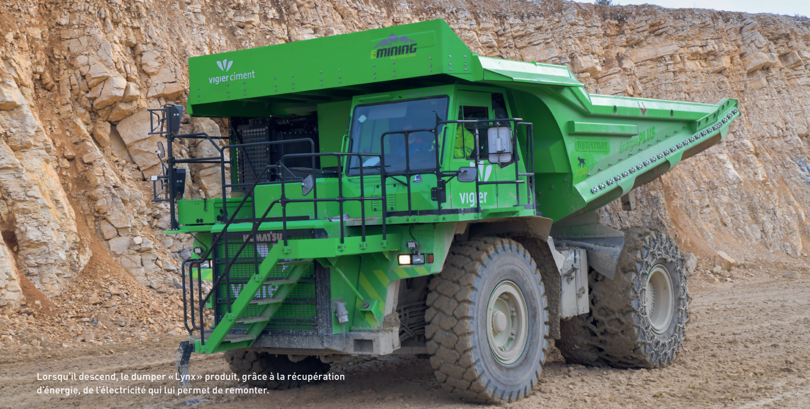
Lorsqu'il descend, le dumper «Lynx» produit, grâce à la récupération d'énergie, de l'électricité qui lui permet de remonter.