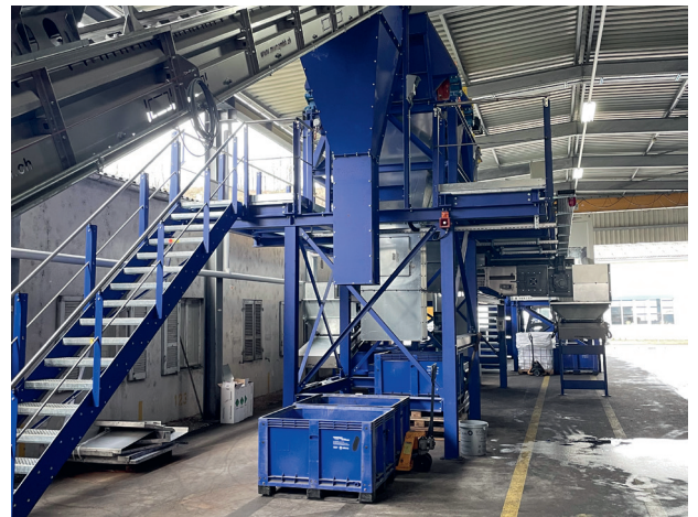
La sécurité avant tout : le convoyeur de la ligne de traitement mécanique des déchets électroniques dispose d'une conduite d'extinction.

Ainsi, 75 à 80% des matériaux sont réintégrés dans le circuit primaire. Les résidus combustibles, comme le bois ou les matières plastiques, servent de combustibles alternatifs dans la cimenterie de Vigier. Depuis quelques