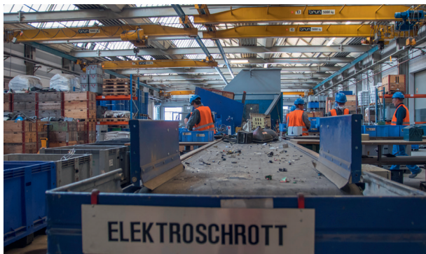
Les déchets électroniques mélangés contiennent des polluants qui doivent être triés manuellement.

Vigier modernise constamment ses installations afin d'améliorer l'efficacité d'utilisation des ressources et de réduire la pollution environnementale. Les filtres-presses à chambres installés ces trois dernières années sur les sites de Vigier Béton à Safnern, Bâle, Oensingen et Tinterin en sont un bon exemple. Ils nettoient l'eau contaminée par des particules de ciment qui s'écoule lors du lavage des bétonnières, des camions malaxeurs et des pompes. Dans les installations, l'eau boueuse de béton est pompée entre des plaques filtrantes, qui sont comprimées par un vérin hydraulique à haute pression. L'eau traverse alors les toiles filtrantes apposées sur les plaques. Après le nettoyage, elle peut être réutilisée pour faire fonctionner le filtre-presse à chambres, créant ainsi un circuit fermé. Selon leur qualité, les gâteaux de filtration produits dans la presse peuvent être utilisés dans le recyclage des matériaux de construction ou déposés dans des décharges.